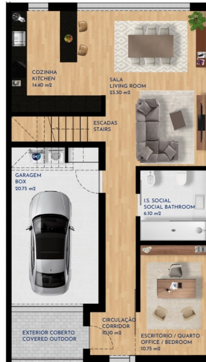
PISO 0 GROUND FLOOR 112 m 2